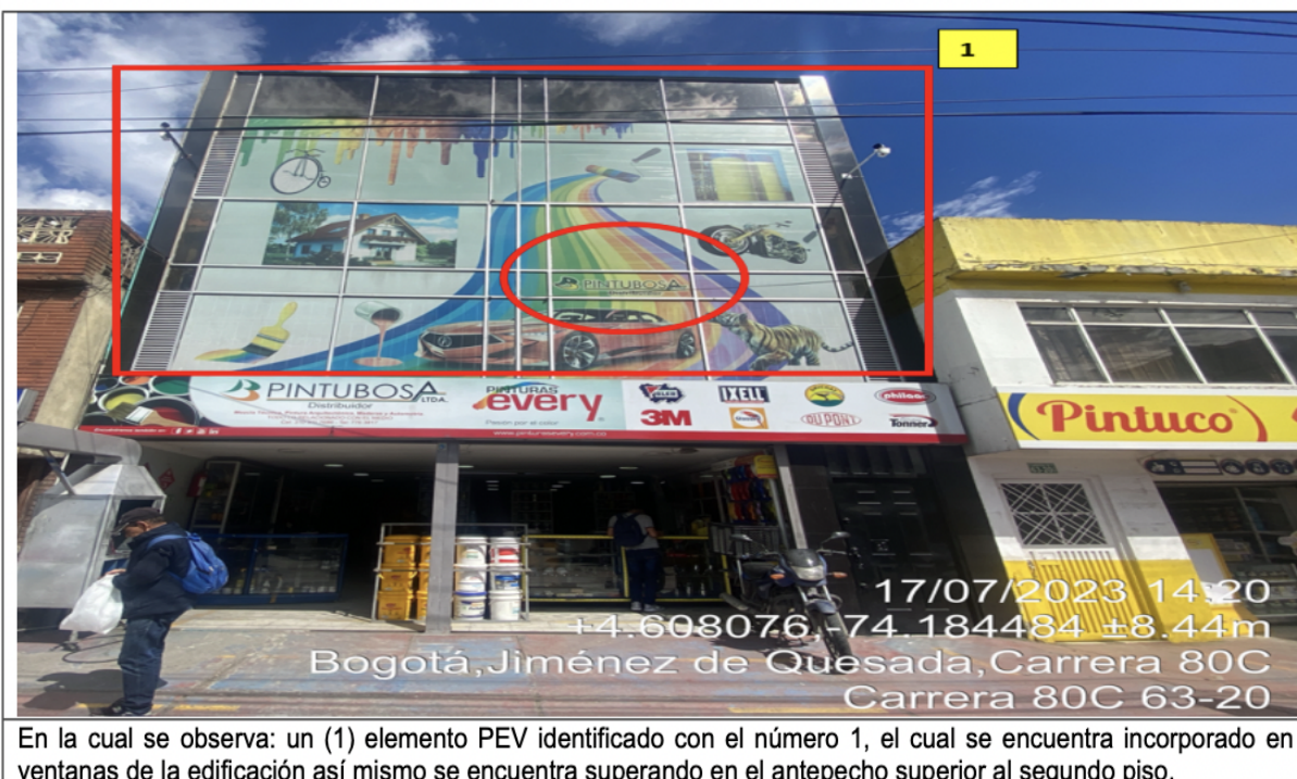
En la cual se observa: un (1) elemento PEV identificado con el número 1, el cual se encuentra incorporado en ventanas de la edificación así mismo se encuentra superando en el antepecho superior al segundo piso.